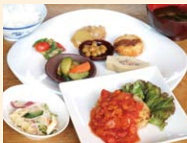
豆カハンバーグランチ ¥1,000